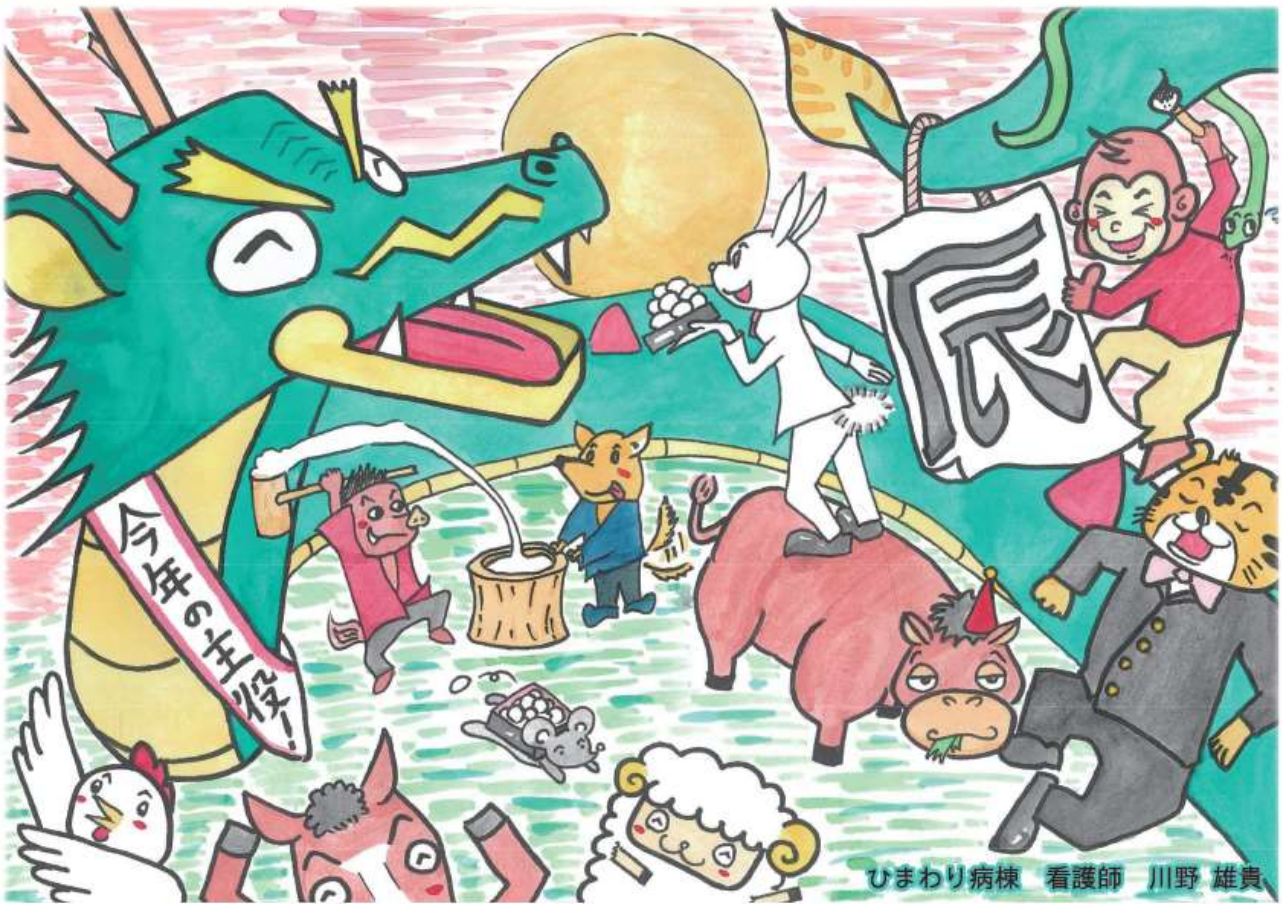
ひまわり病棟 看護師 川野 雄貴